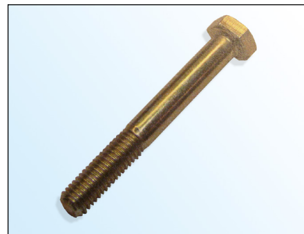
Obrázek 2: OE-šroub

V rámci neustálého vývoje našich produktů dodává LuK-AS s napínací kladkou 531 0274 30 nový šroub ( obrázek 3 ).