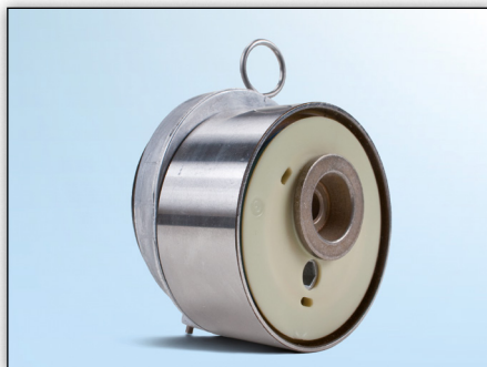
Obrázek 1: Pohled zepředu na dosavadní verzi