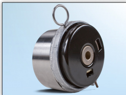
Obrázek 3: Pohled zezadu na dosavadní verzi