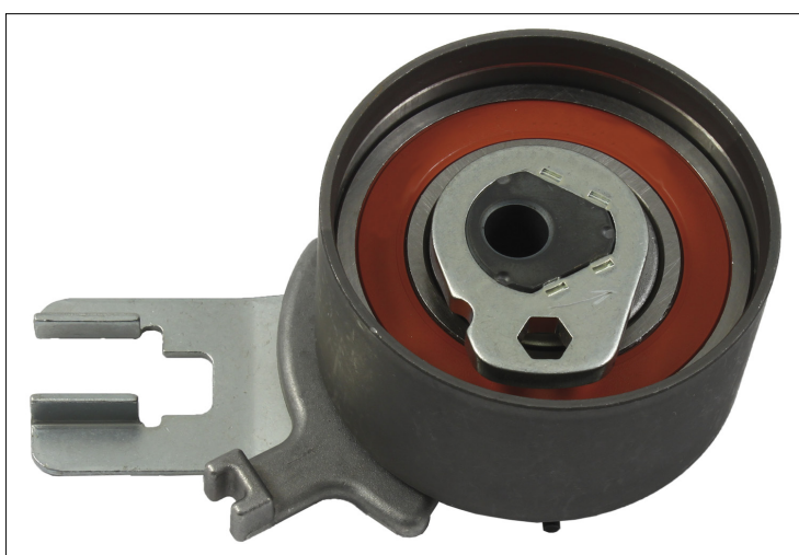
Obrázek 1: 531 0859 10 – nová napínací kladka

30638278 (nahrazeno) 30677134 (nahrazeno) 30731774 (nahrazeno) 31316658 (nahrazeno) 31316999 (nahrazeno) 31339542 (aktuální) 31258305 (sada, nahrazeno) 31330188 (sada, nahrazeno) 31359568 (sada, aktuální)