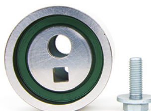
Obrázek 2: 531 0780 10 - napínací kladka INA s přiloženým šroubem